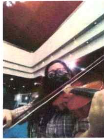
Realizando el ensayo de la Primera lectura en el área de violín II.