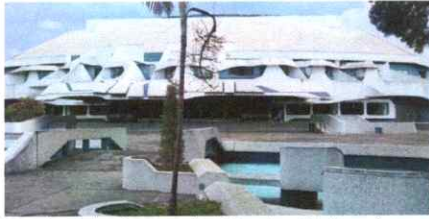
Instalaciones del Centro Cultural. Miguel Ángel Asturias.