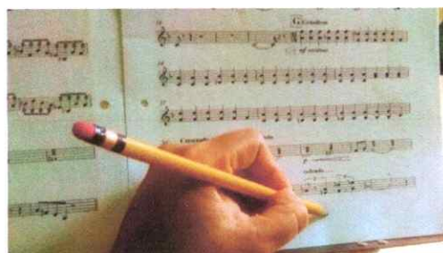
Anotaciones en la partitura