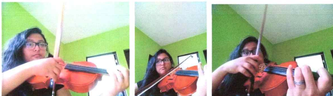
Práctica individual del inicio del Acto I

de registro que me facilitaran las arcadas, matizaciones e indicaciones que se realizaron en el ensayo para anotarlas en mis partituras en físico.