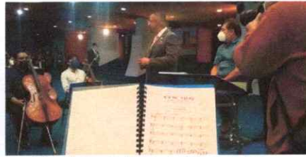
Palabras de bienvenida a cargo del Viceministro y de los organizadores de la Ópera.